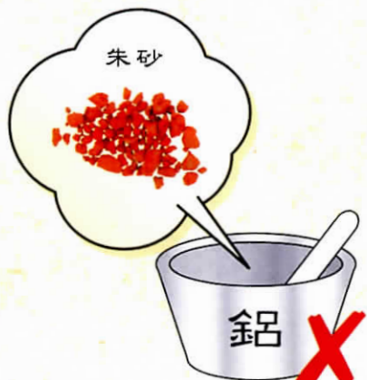
朱砂不可用 鋁製器具研末

中藥須用正確的方法煎煮，以發揮藥效及減低個別藥材的毒性和副作用。因此煎煮，要遵照中醫師的煎煮指示，藥材免煎煮不當導致不良反應。