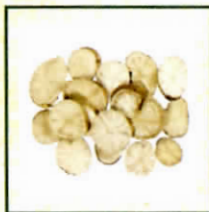
防己科 防己 《中醫藥條例》 附表2中藥材*