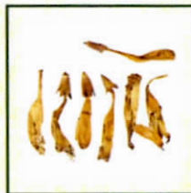
紫葳科 凌霄花 《中醫藥條例》 附表2中藥材*

*《中醫藥條例》附表1內包括31種毒性中藥材，須經註冊中醫處方才可購買；附表2則包括574種香港常用的中藥材。