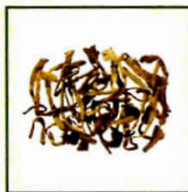
茄科 洋金花 《中醫藥條例》 附表1中藥材*