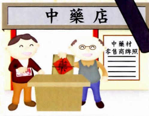
到持牌的中藥店購買中藥