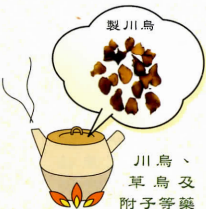
川烏、 草烏及 附子等藥 材的生品只可外用， 炮製品內服時要先煎 及久煎