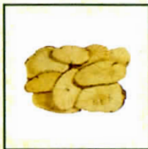
馬兜鈴科 廣防己 (已於2004年 6月1日禁止在 香港銷售)